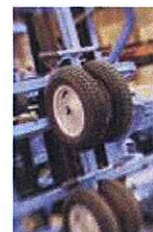
Detalle de las ruedas direccionales Detail of directional wheels Détail des roues directionnelles