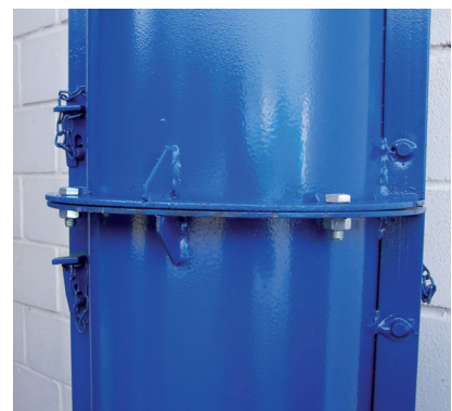
Detalle de unión de un Encofrado Circular con otro verticalmente mediante tornillos y tuercas.