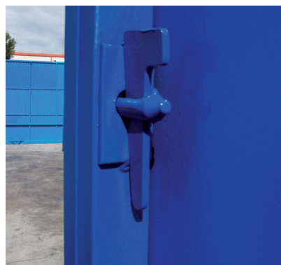
Detalle de unión mediante bulón y cuña para diámetros desde 55 cm hasta 100 cm y en todas las alturas.